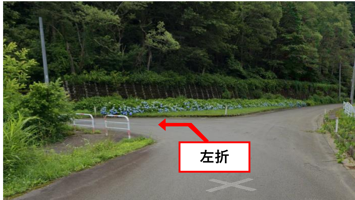
写真② 月山大橋を渡ったのち分岐を左折し、しばらく道なりに進む